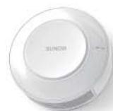
雙流新風機 進風型