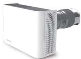
綠境風 雙流新風機